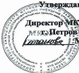
График проведения обеззараживания воздуха с использованием рециркуляторов закрытого типа (ОВУ-04) № 5 на 2020-2021 учебный год. (Раздевалки спортивного зала)