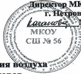
График проведения обеззараживания воздуха с использованием рециркуляторов закрытого типа (ОВУ-04) № 1 на 2020-2021 учебный год. (1 этаж старого здания, учительская)