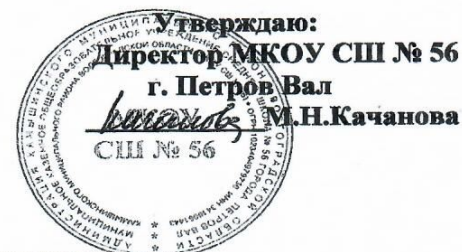
График проведения обеззараживания воздуха с использованием рециркуляторов закрытого типа (ОРУБи-3-3 «Кронт» (Дезар-4)) № 10 на 2020-2021 учебный год. (1 этаж старого здания)