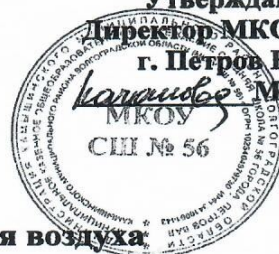
График проведения обеззараживания воздуха с использованием рециркуляторов закрытого типа (ОВУ-04) № 2 на 2020-2021 учебный год. (1 этаж старого здания)