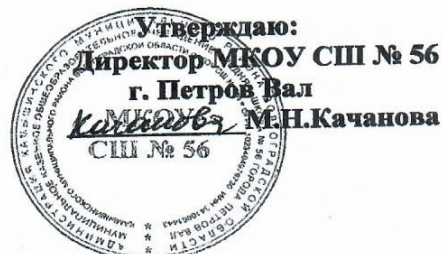
График проведения обеззараживания воздуха с использованием рециркуляторов закрытого типа (ОВУ-04) № 11 на 2020-2021 учебный год. (1 этаж старого здания, столовая)